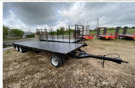
Surface utile : 9m00 x 2m54, Tourelle, RJ 215/75 R17.5, Echelle av/arr avec rallonge, Rampes Aluminium...