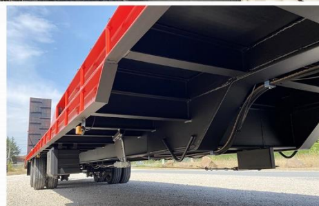
Surface utile : 11m70 x 2m54, Tourelle, RC 235/75 R17.5 Jum., Carré 20 sur plateforme, Cale-Roue...