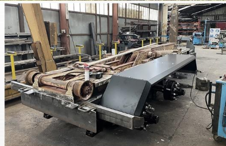
Bras recond., Freinage Mixte, RC 560*60 R22.5 FL630, Anneau fixe soudé, pompe à pistons 80L/min 350b...

Sarl BCM - D910 La Normandie - 37110 VILLEDOMER - 02.47.550.100 - www.remorques-bcm.com