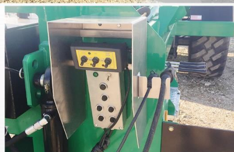
Bras reconditionné, Flèche à suspension hydraulique, suiveur 'Autopiloté', RC 560*60 R22.5 FL630 Sarl BCM - D910 La Normandie - 37110 VILLEDOMER - 02.47.550.100 - www.remorques-bcm.com