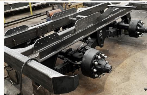
Bras neuf Ampliner, RC 560*60 R22.5 FL630, Essieu suiveur arrière, Potence grande longueur puissance 20T...