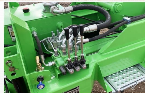
Bras recon., Freinage Air 40Km/h, RC 560*60 R22.5 FL693, Anneau boulonné, Susp. flèche Hydro, suiveur AutoPiloté...

Sarl BCM - D910 La Normandie - 37110 VILLEDOMER - 02.47.550.100 - www.remorques-bcm.com