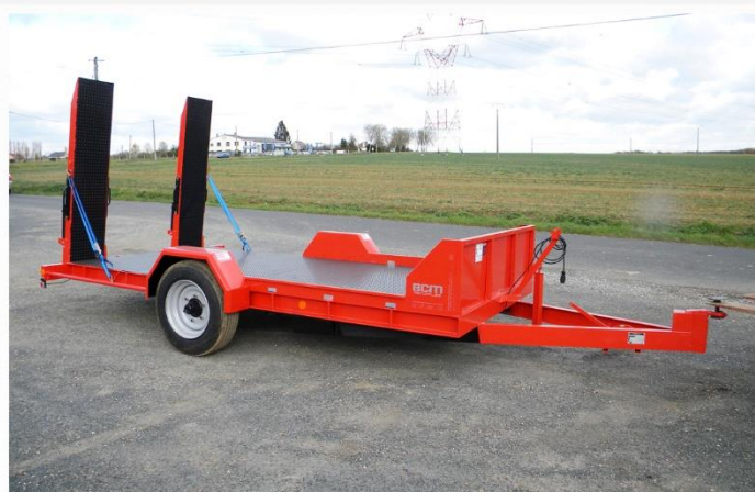
Surface utile : 4m00 x 2m04, Essieu fixe, RC 215/75 R17.5, Fermeture grille avant, Ridelles avant