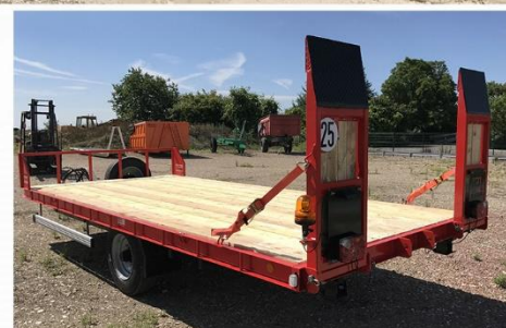
Dim. : 5m50 x 2m54, RC 235/75 R17.5 + RS, Plateau Basculant, Anneau tournant, Plate-forme Bois Intégrale...