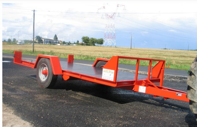
Surface utile : 4m00 x 2m04, Plateau basculant hydraulique, Essieu fixe, RC 215/75 R17.5