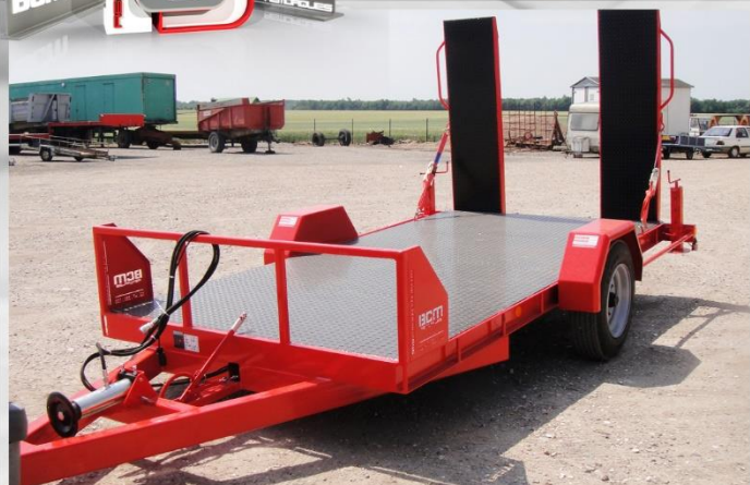
Surface utile : 4m00 x 2m04, Essieu fixe, RC 215/75 R17.5, poignées sur rampes

PORTE-ENGINES 3T PIC PORTE-ENGINES 6T PIC PORTE-ENGINES 7T PIC