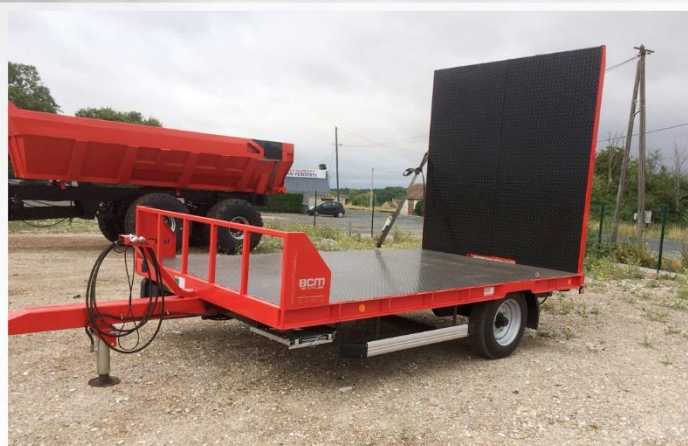
Surface utile : 4m00 x 2m40, Plancher plat, Essieu fixe, RC 215/75 R17.5, Rampe sur largeur totale