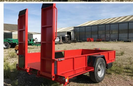
Dim. : 4m00 x 2m04, RC 285/70 R19.5, Ridelles fixes, Plancher rampes Métal déployé, Feux incorporés traverses arr...

Sarl BCM - D910 La Normandie - 37110 VILLEDOMER - 02.47.550.100 - www.remorques-bcm.com