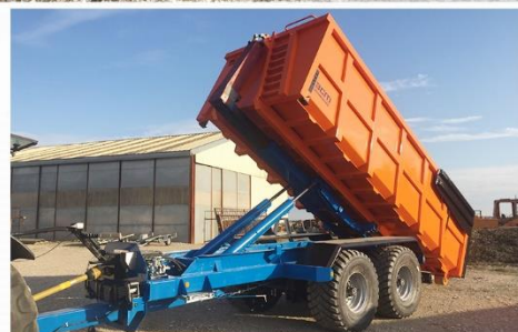
Bras reconditionné, RC 560*60 R22.5 FL693, Rallonge double effet Arr. avec coupleurs DDSP, Cardan Homocinétique...