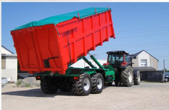
Bras reconditionné, Tandem 'Standard', suiveur 'Classique', Rallonge hydraulique avec prises DDSP