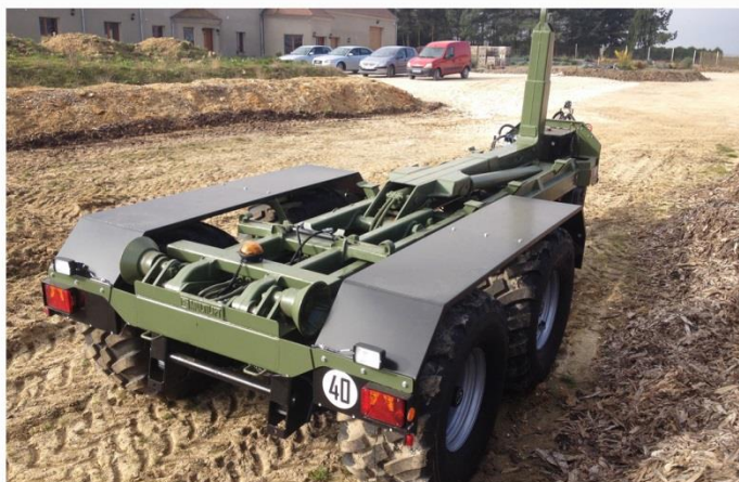
Bras reconditionné, Freinage AIR 40km/h, RC 560/60 R22.5, Pompe engrenages 118l/min, attelage Calotte