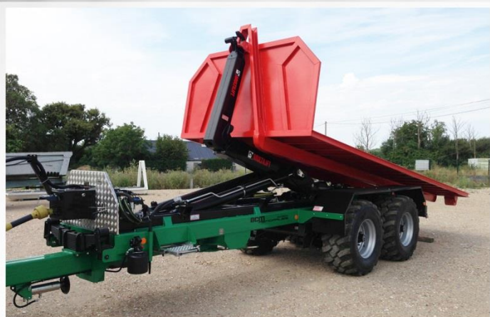
Bras NEUF HIAB, Tuyauterie rigide sur vérin de levage, support berce pour libération effort sur rouleur