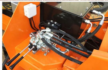
Bras reconditionné, Freinage AIR 40km/h, suiveur 'Classique', RC 560*60 R22.5 FL630, Système élévateur arrière...