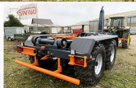
Bras recon., Freinage Mixte, RC 560*60 R22.5 FL630, Anneau boulonné, Prise hydraulique arrière avec coupleurs D.D.S.P. ...

Sarl BCM - D910 La Normandie - 37110 VILLEDOMER - 02.47.550.100 - www.remorques-bcm.com