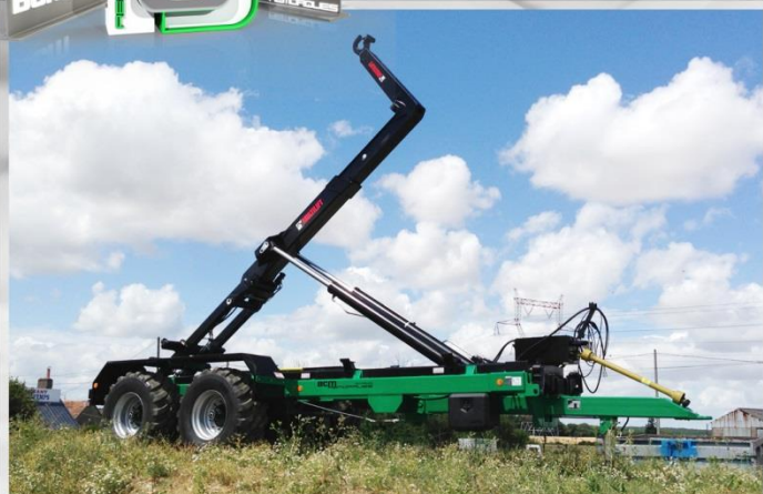
Bras NEUF HIAB, Tandem 'Surbaissé', RC 500/60 R22.5, groupe Pompe-Distributeur indépendant

PORTE-CAISSONS 18t PIC PORTE-CAISSONS 24t PIC PORTE-CAISSONS 29t PIC