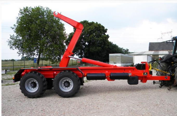
Bras reconditionné, Freinage AIR 40km/h, suiveur 'Classique', Anneau à boulonner