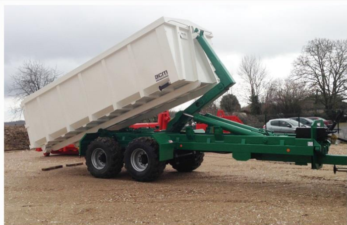
Bras reconditionné, suiveur 'Classique', RC 500/60 R22.5, Pompe à main sur béquille avant Sarl BCM - D910 La Normandie - 37110 VILLEDOMER - 02.47.550.100 - www.remorques-bcm.com