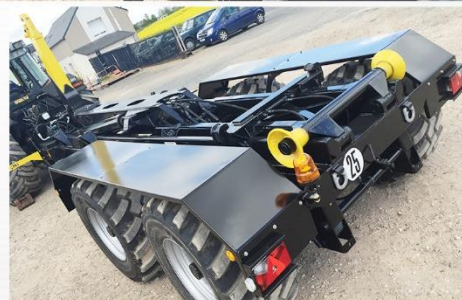
Bras reconditionné, suiveur 'Classique', RC 500*60 R22.5 FL630