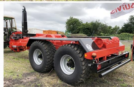
Bras reconditionné, RC 560*60 R22.5 FL693, Anneau boulonné, Prise hydraulique arrière avec coupleurs D.D.S.P. ...