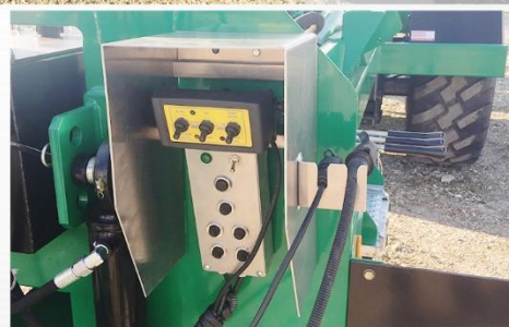
Bras reconditionné, Flèche à suspension hydraulique, suiveur 'Autopiloté', RC 560*60 R22.5 FL630 Sarl BCM - D910 La Normandie - 37110 VILLEDOMER - 02.47.550.100 - www.remorques-bcm.com