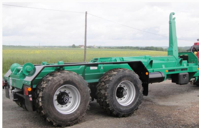
Bras reconditionné, Freinage Mixte 25km/h, suiveur 'Classique', RC 560/60 R22.5