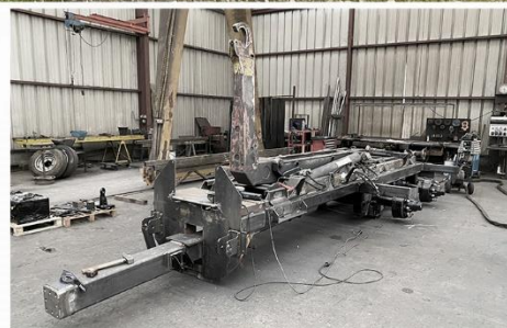
Bras reconditionné, RC 560*60 R22.5 FL630, Anneau tournant boulonné, Prise hydro. arrière avec coupleurs D.D.S.P. ...