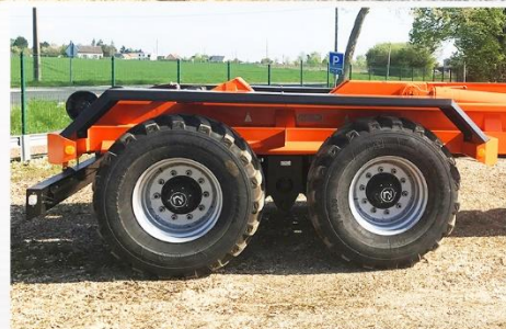
Bras reconditionné, RC 500*60 R22.5 FL630, Rallonge double effet Arr. avec coupleurs DDSP, Sarl BCM - D910 La Normandie - 37110 VILLEDOMER - 02.47.550.100 - www.remorques-bcm.com