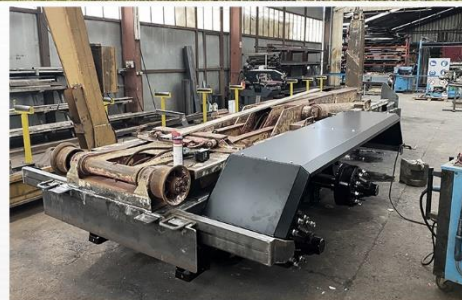
Bras recond., Freinage Mixte, RC 560*60 R22.5 FL630, Anneau fixe soudé, pompe à pistons 80L/min 350b... Sarl BCM - D910 La Normandie - 37110 VILLEDOMER - 02.47.550.100 - www.remorques-bcm.com