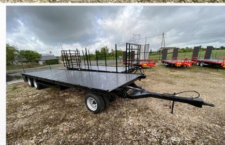
Surface utile : 9m00 x 2m54, Tourelle, RJ 215/75 R17.5, Echelle av/arr avec rallonge, Rampes Aluminium...